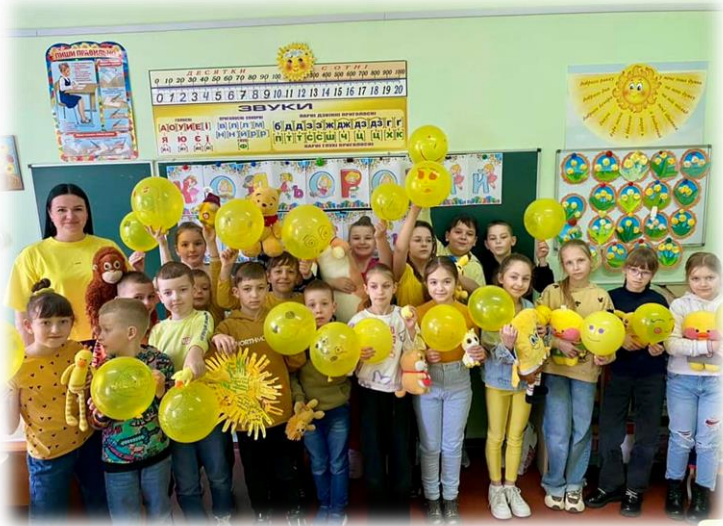
День 5. Жовтий, щасливий