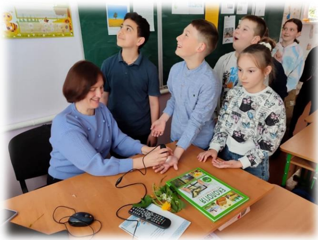
День 3. Синьо-зелений, навковий