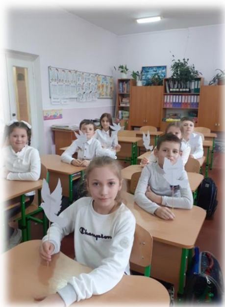
День 2. Білий. «Ми за МИР»