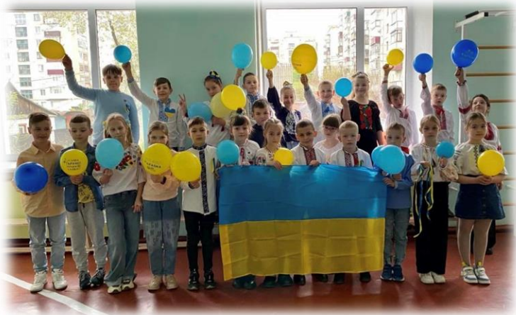
День 1. Жовто-блакитний, патріотичний