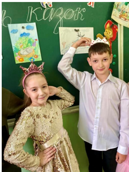
День 4. Фіолетовий, казковий